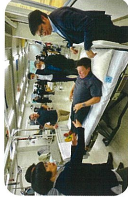
ノーリフティング体験会・イメージ