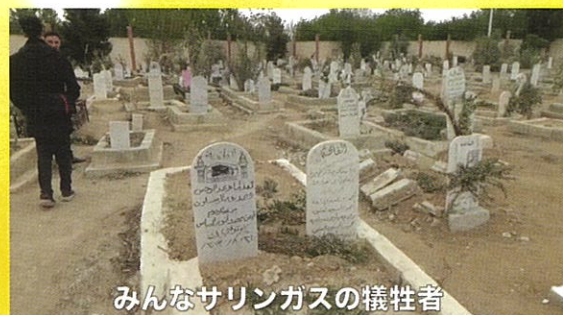
みんなサリンガスの犠牲者